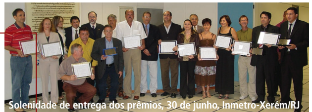
Solenidade de entrega dos prêmios, 30 de junho, Inmetro-Xerém/RJ